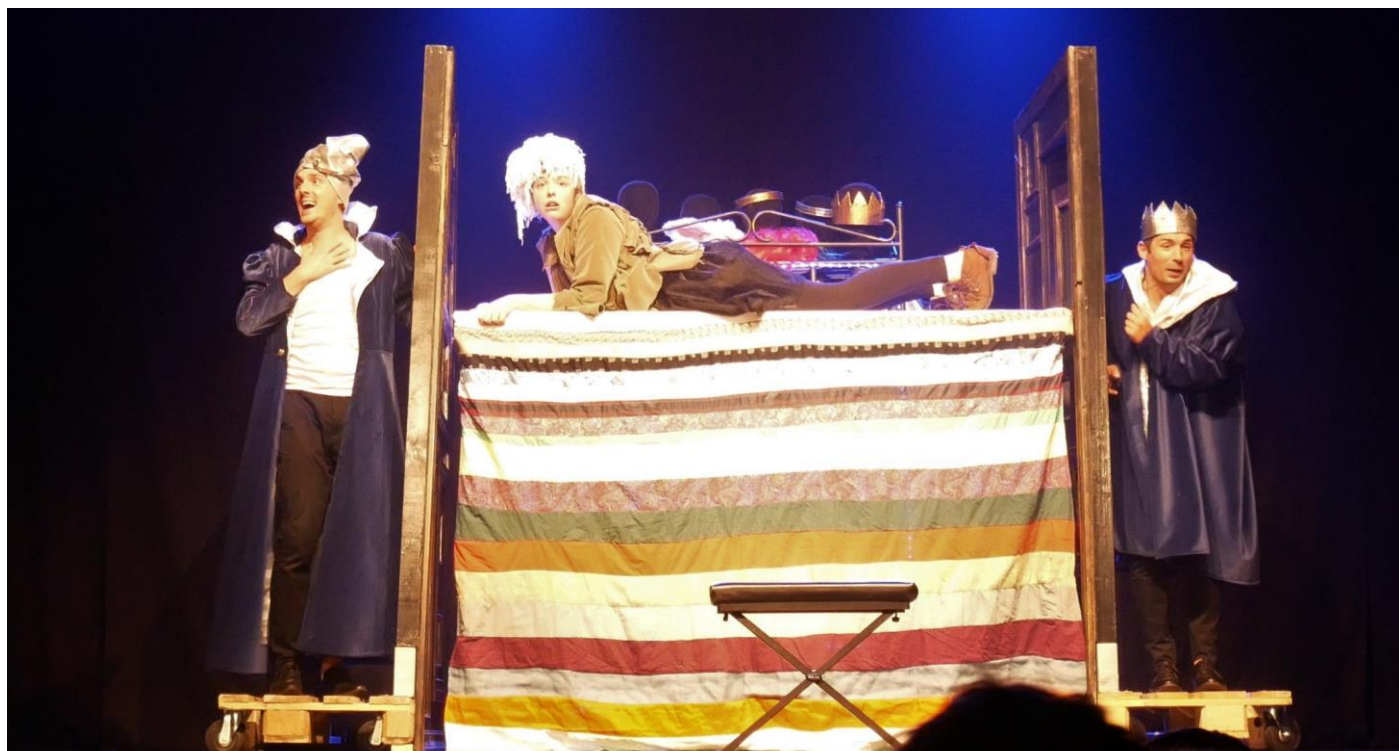
Les photos du livret ont été prises le 12 octobre 2018 lors de la création du spectacle à L'Agora, Commeny.